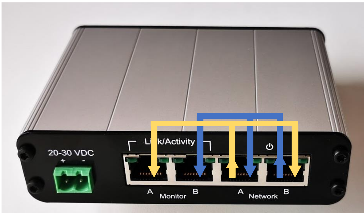
Abbildung 1 - Interne Verbindungen

Abbildung 1 zeigt die internen Verbindungen und Abbildung 2 zeigt, wie der EtherMIRROR mit dem EtherTAP verbunden ist.